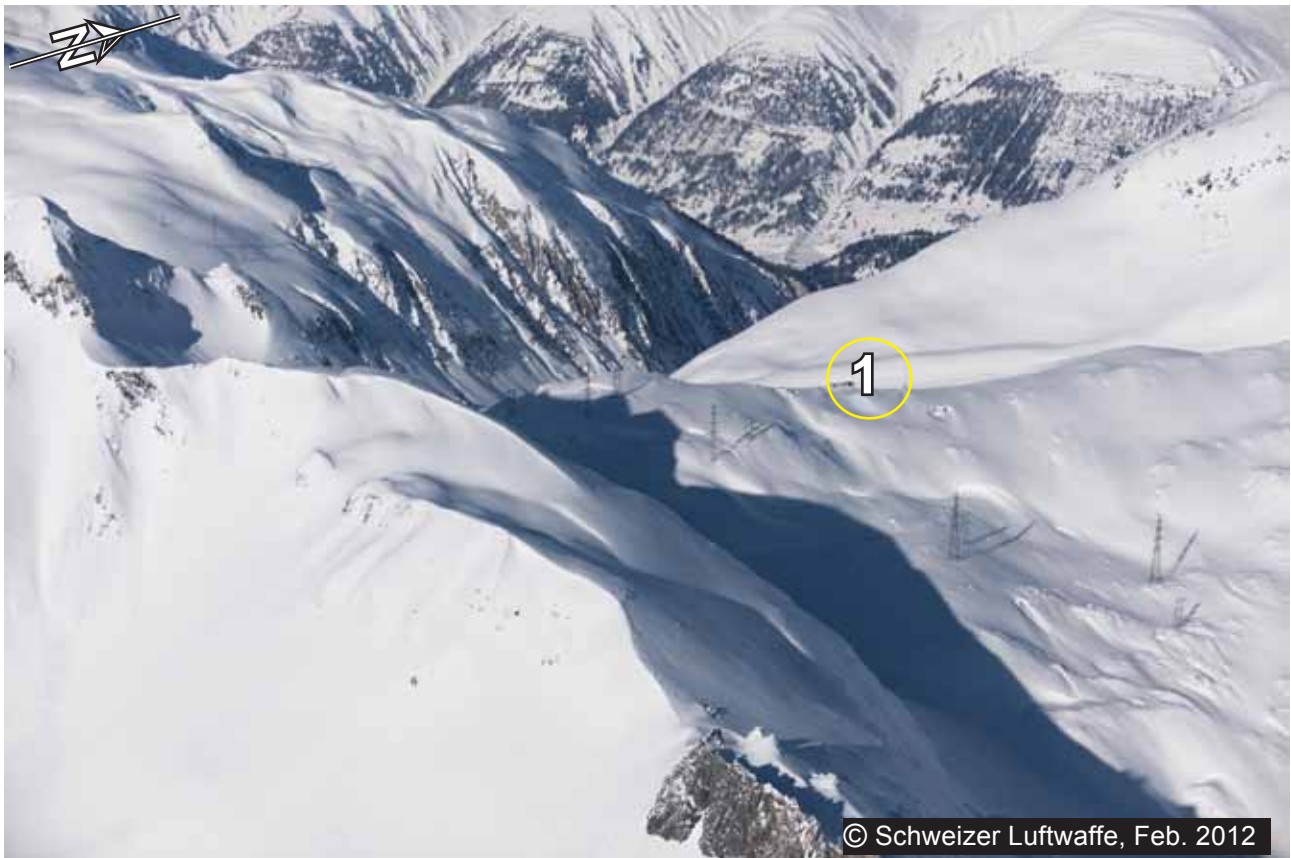
1 Passhöhe Nufenenpass