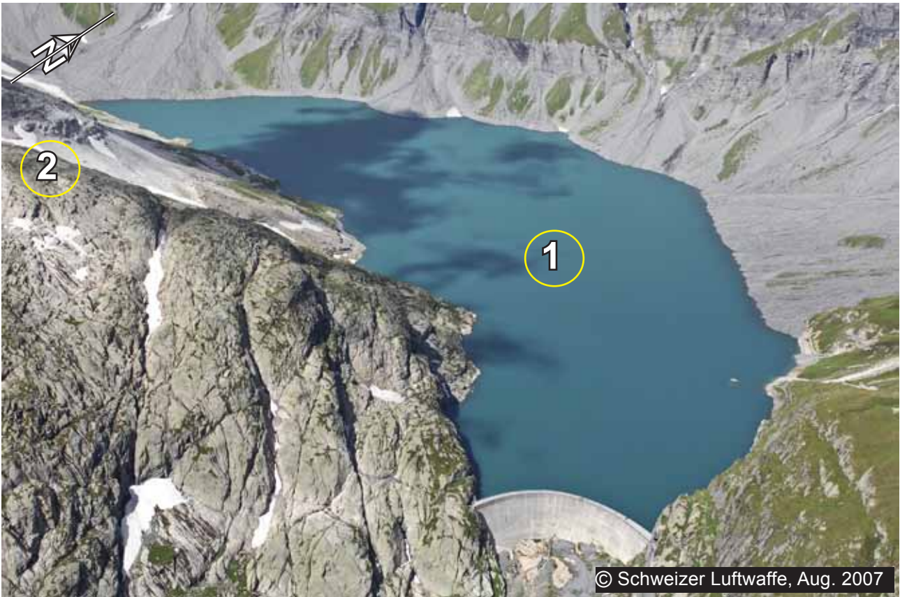
1 Lac du Vieux Emosson (2205 m)