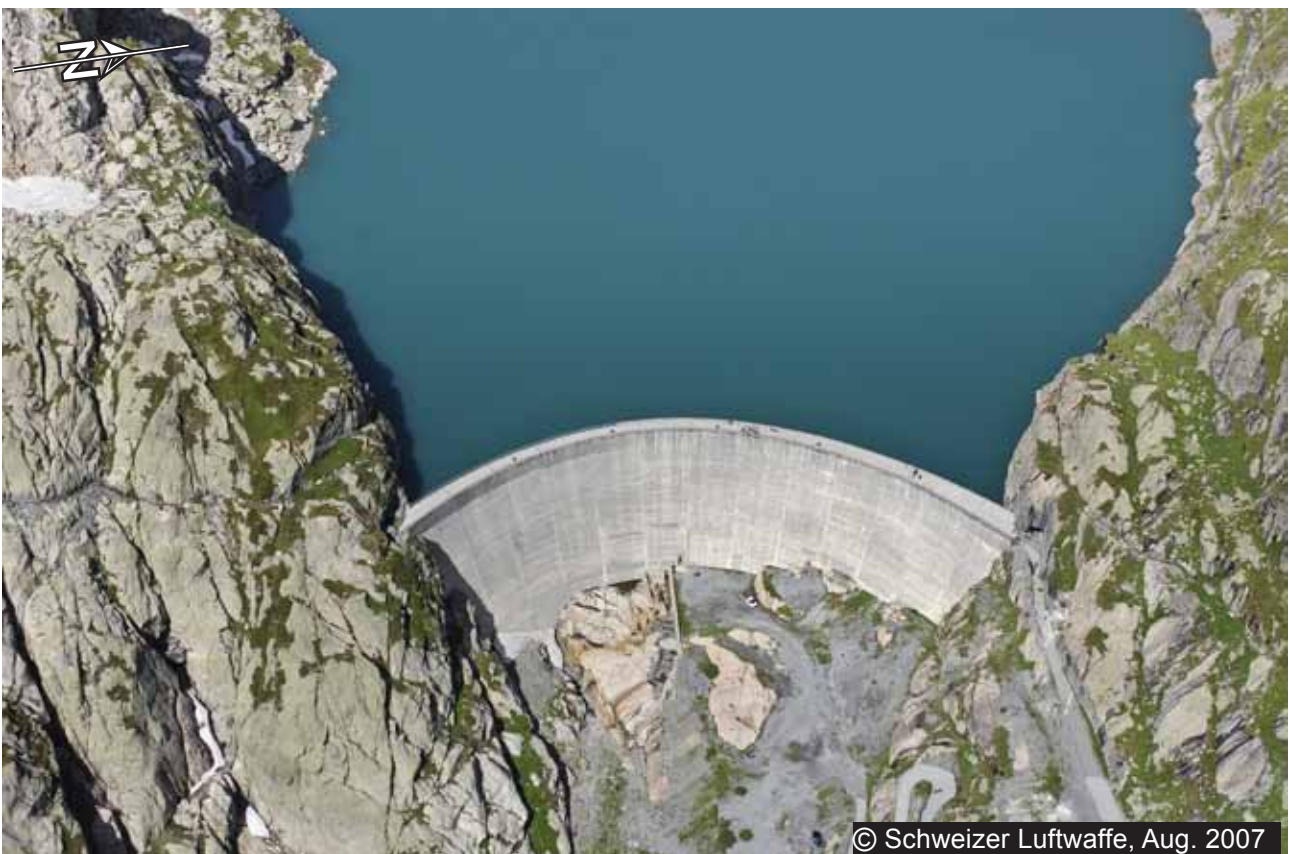
2 La Veudale (2492 m)